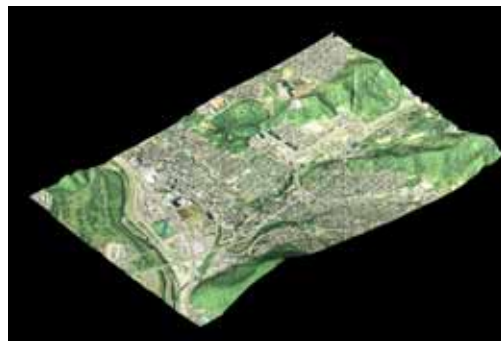
歪みが補正されて X, Y, Z の値を持った オルソフォト・データ